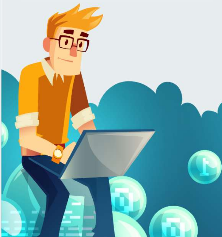
Report dei lavori eseguiti in tempo reale con esportazione verso i software di fatturazione